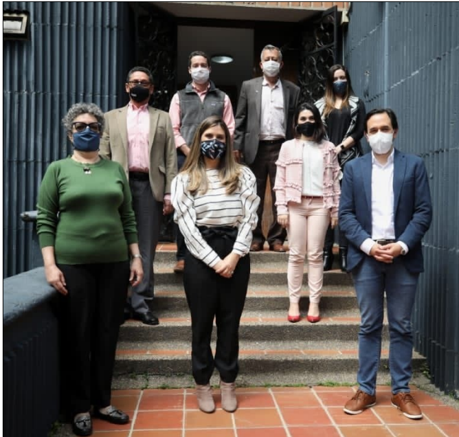
Reunión con el Ministro de Minas, Dr. Diego Mesa.