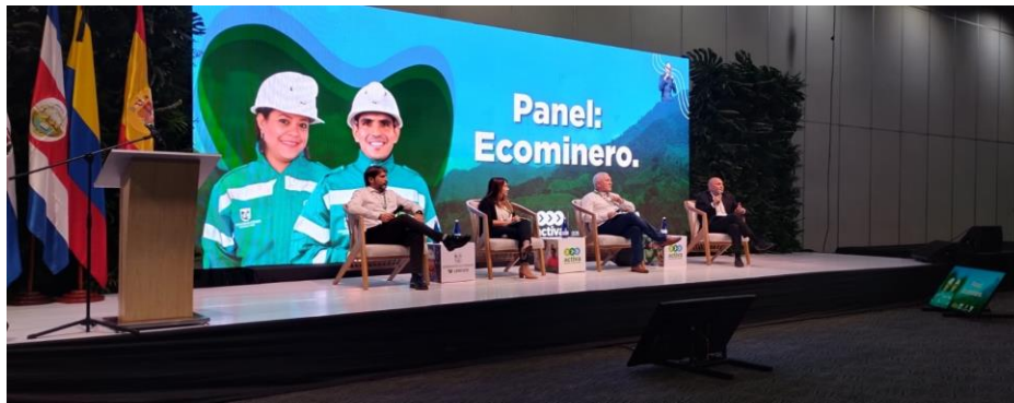
Ilustración 14, Panel: Ecominería, una mirada desde las buenas prácticas, cumbre internacional eco minera II.