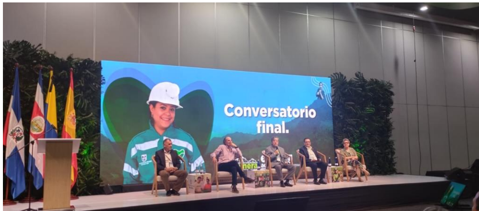
Ilustración 21, representantes de; APMC, Iniciativa por la Minería Responsable, ACM, ACEXPLO. cumbre internacional eco minera.

Recalca mucho el hecho de que la política minera es deficiente, que la minería requiere que les dejen hacer su trabajo, que el tema de las licencias es dado de forma arbitraria.