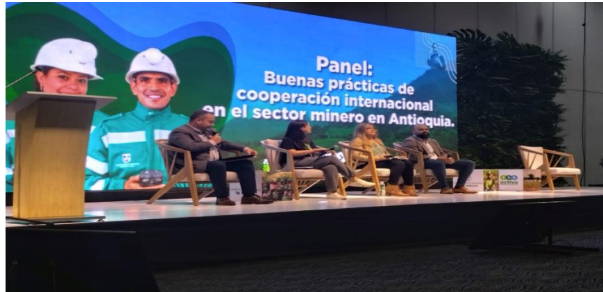
Ilustración 10, ARM, USAID, Swiss Better Gold. (S.B.G), Unisabaneta. cumbre internacional eco minera II