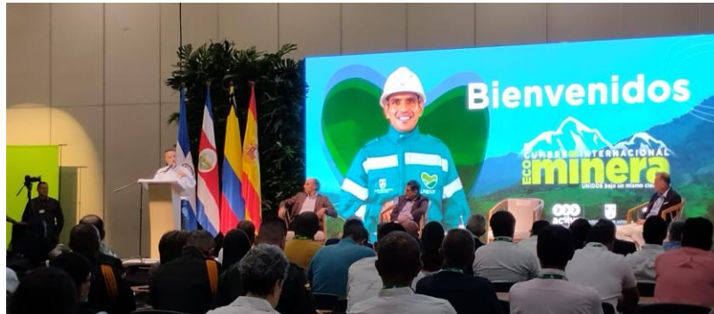
Ilustración 2, gobernador de Antioquia Aníbal Gaviria, cumbre internacional eco minera II.

Hace un especial énfasis en el contexto de violencia que se encuentran diversas zonas mineras del país e igualmente, con el laboratorio para la vida quieren dar vuelta a esta situación iniciando con las zonas del Bajo Cauca.