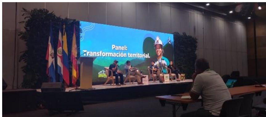
Ilustración 12, panel transformación territorial, cumbre internacional eco minera II.

3. Los impactos percibidos sobre los impactos objetivos, en las comunidades que se hace la minería se presentan unos impactos percibidos que van más allá de los objetivos (tráfico pesado, alteración a fuentes hídricas, entre otras) las cuales pueden ser solucionadas por el diálogo.