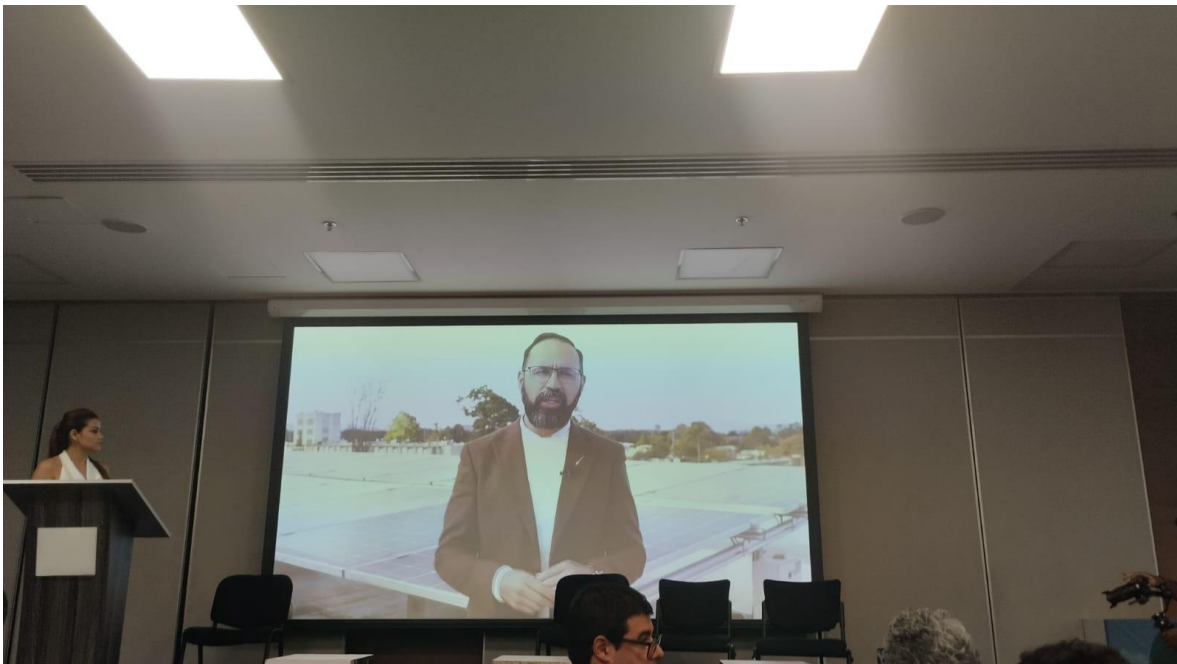
Ilustración 26, ministro de minas, cumbre internacional eco minera II.

El ministro de minas no pudo asistir, pero envió un video agradeciendo por el evento y el trabajo realizado e instando a promover más espacios de esta índole.