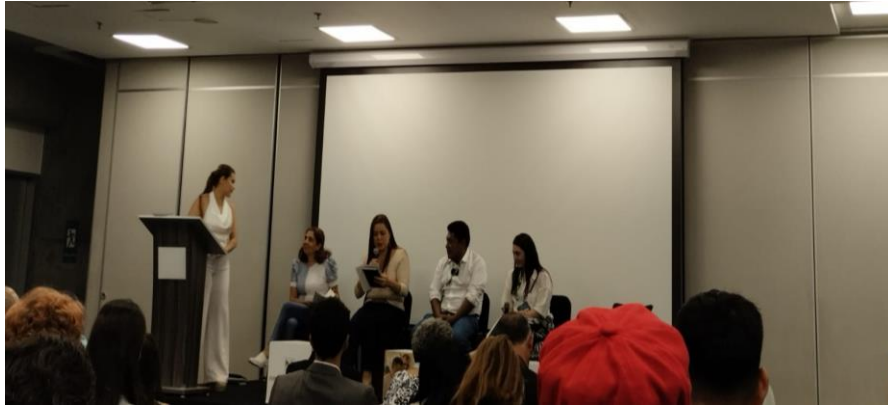
Ilustración 25, Voceros municipales Buenos Vecinos, cumbre internacional eco minera II.

Tras este evento hubo un pequeño retraso lo cual ocasionó que algunos de los eventos propuestos en la agenda inicial no se presentaron o fueron tocados sus puntos en conversaciones anteriores.