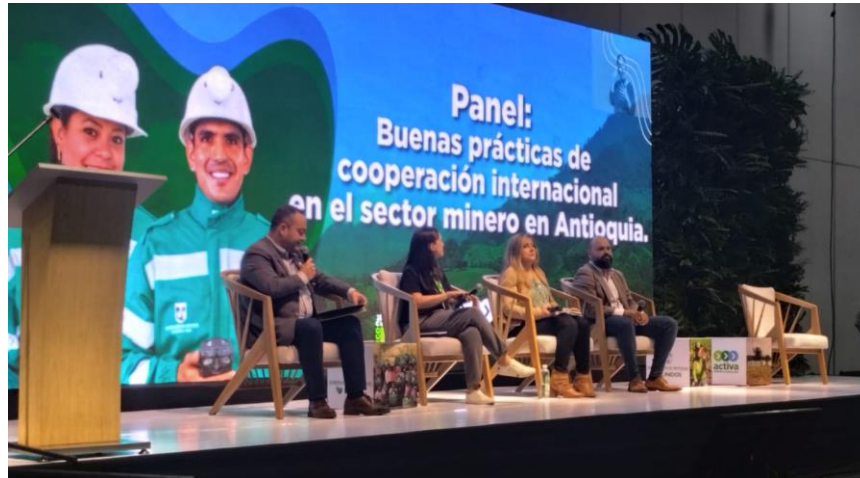
Ilustración 20, Gold by Gold, Cooperativa Financiera de Antioquia, GDIAM regional: Bancarización. Cumbre internacional eco minera II.