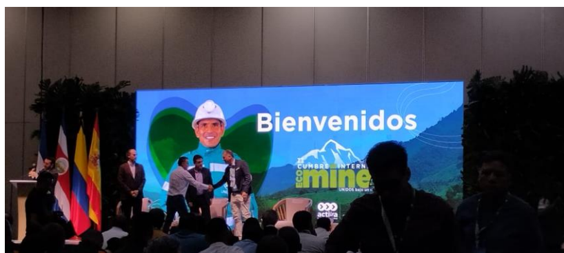
Ilustración 1. Apertura por parte de las autoridades, cumbre internacional eco minera II.