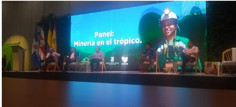
Ilustración 7, Panel minería en el trópico, cumbre internacional eco minera II.

3. Como cada unidad minera está centrada en la transición energética: Considera que es un reto convertir al pequeño minero en empresario debido al tema económico y que no se puede hablar de transición energética sin antes ver la transición económica.