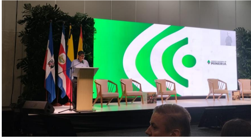
Ilustración 8, presidente de la ANM, cumbre internacional eco minera II.