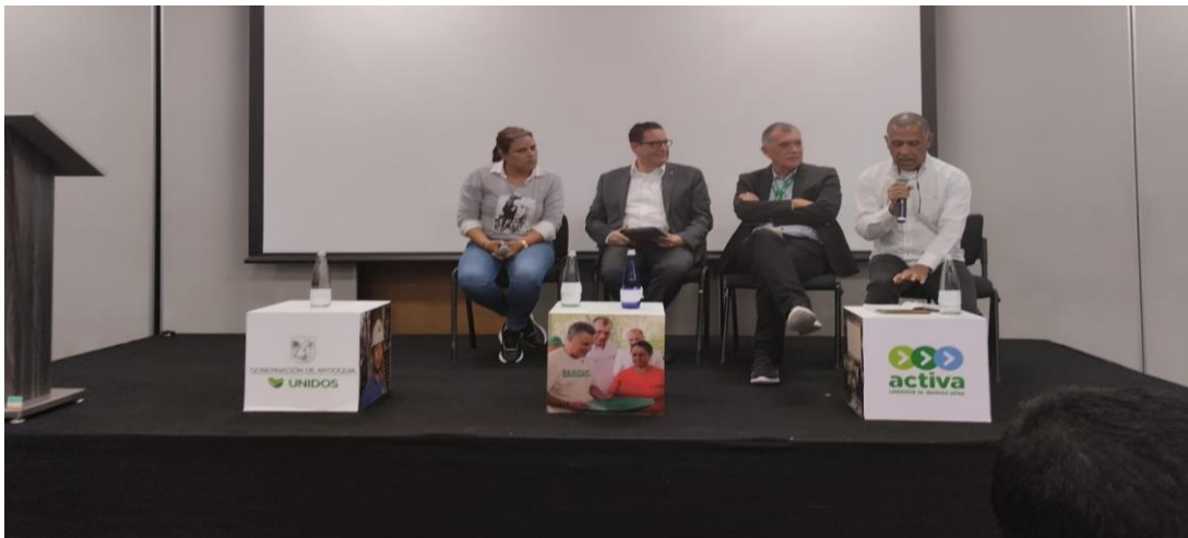
Ilustración 27, representante Asoagrominero, presidente APMC y secretario de minas; cumbre internacional eco minera II.