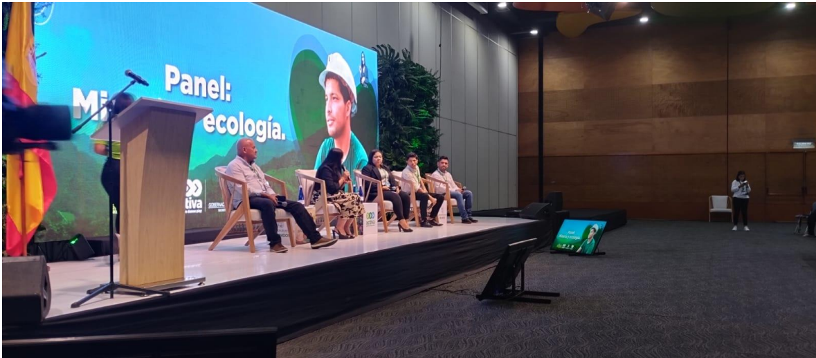
Ilustración 18, 2:30 pm- Panel: Minería y ecología, una mirada desde la formalización.,