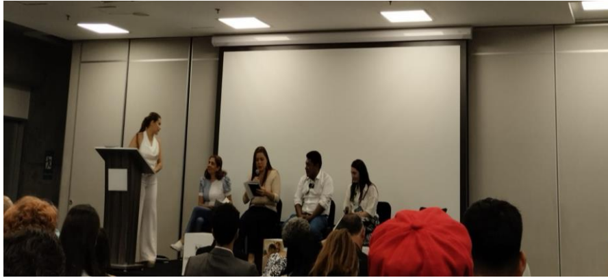
Ilustración 25, Voceros municipales Buenos Vecinos, cumbre internacional eco minera II.

Tras este evento hubo un pequeño retraso lo cual ocasionó que algunos de los eventos propuestos en la agenda inicial no se presentaron o fueron tocados sus puntos en conversaciones anteriores.