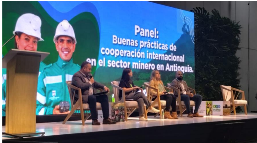
Ilustración 20, Gold by Gold, Cooperativa Financiera de Antioquia, GDIAM regional: Bancarización. Cumbre internacional eco minera II.