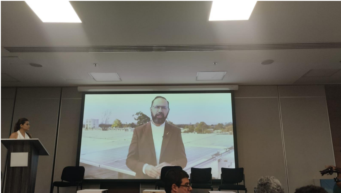
Ilustración 26, ministro de minas, cumbre internacional eco minera II.

El ministro de minas no pudo asistir, pero envió un video agradeciendo por el evento y el trabajo realizado e instando a promover más espacios de esta índole.